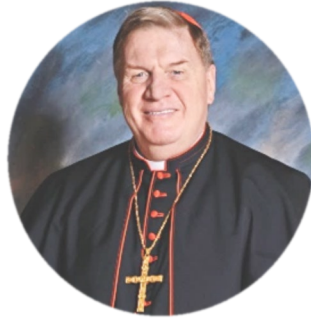
Cardenal Joseph W. Tobin, C.Ss.R. Arzobispo de Newark