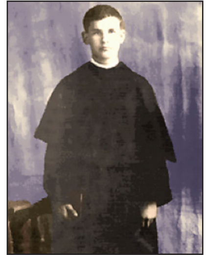
Beato fray José López Piteira

Las vidas de los beatos y santos católicos son una inspiración para nuestra práctica diaria de la fe y creo que a tono con la celebración que se aproxima del Día de Acción de Gracias,