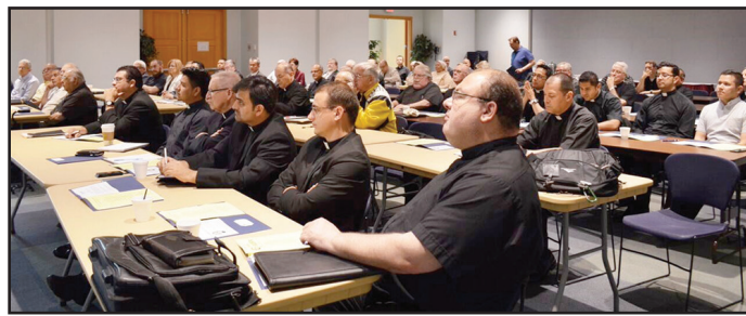
Sacerdotes y diáconos de nuestra Arquidiócesis escuchan la presentación de Mons. Nelson Pérez sobre el Quinto Encuentro Nacional Hispano.

tos para nuestras comunidades. ¿Y cómo va a ser este Quinto Encuentro? Ante todo será un proceso en el que participarán más de 5,000 parroquias en 175 diócesis de los Estados Unidos. Y con un alcance de un millón de líderes pastorales. Es decir, que lo que nosotros vamos a vivir, lo experimentarán muchísimas personas en los cuatro puntos cardinales del país.