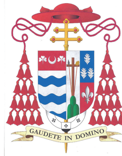
CARDINAL JOSEPH W. TOBIN Escudo de Armas

Agradecemos de corazón al arzobispo Joseph Myers su dedicación al servicio de nuestra iglesia de Newark durante estos últimos quince años y le damos la bienvenida calurosa a nuestro nuevo pastor. ¡Bienvenido, Cardenal Tobin! Nuestra casa es su casa.