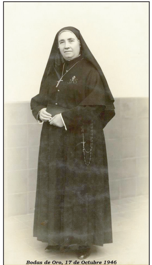
Bodas de Oro, 17 de Octubre 1946